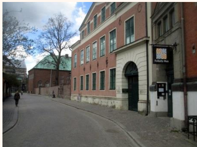
Platsen där Svartbrödraklostret fanns tidigare.

På tomten som dominikanerna tilldelades uppförde de ett stort fyrårigt kloster som helgades åt Sankta Maria Magdalena med en klosterkyrka som helgades åt Jesus mor, jungfru Maria. Bland allmänheten i Lund blev det känt som Svartbrödraklostret .