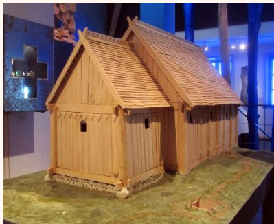
En modell av Svend Tveskægs stavkyrka som man kan se hos kulturhistoriska museet Kulturen i Lund.