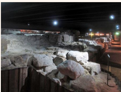
Museet Drottens kyrkoruin.

Drottens antas dock ha fungerat som biskopskyrka under hela tiden som Sankt Laurentius och den nuvarande Lunds domkyrka byggdes. Efter reformationen av den danska kyrkan år 1536 revs Drottens kyrka och resterna av den finns nu kvar som det obemannade museet Drottens kyrkoruin .