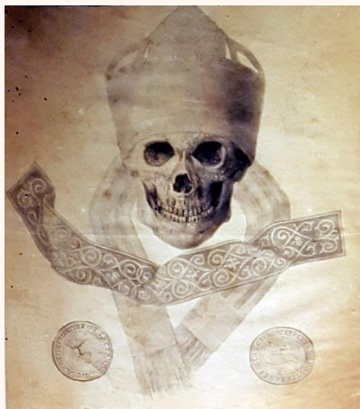
Teckning av Anders Sunesens kranium.

I samband med att Anders Sunesens sarkofag öppnades så gjordes det en teckning av hans kranium och den mitra och det halslin som han bar på.