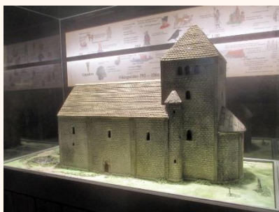
En modell av Trinitatis-Salvatorkyrkan Drotten.

Kampen för ett skandinaviskt ärkesäte i Lund fortsatte med Svend Tveskægs son Knut den Store . Han lät bygga en än större biskopskyrka av sten, Trinitatis-Salvatorkyrkan som även kallades för Drotten, omkring år 1020 . Den engelske prästen Bernhard blev kyrkans biskop . Det fanns två gravkammare i den kyrkan och det antas att Bernhard begravdes i den ena och att Knut den Store lät flytta kvarlevorna efter sin far Svend Tveskæg till den andra gravkammaren.