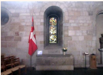
Den äldre Dannebrog står vid Anders Sunesens sarkofag i Lunds domkyrka den 15 juni varje år.

Enligt legenden om den danska flaggan Dannebrog så lyfte Anders Sunesen då sina armar och bad om Guds hjälp. Då föll Dan- nebrog ner från himlen , se bilden på den här folderns förstasida, och en röst från himlen sa till dem att de skulle segra när den restes . Till slut lyckades korsfararna faktiskt också driva esterna på flykt.