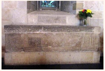
Anders Sunsens sarkofag i Dopkapellet.

Denna broschyr har tagits fram av Lunds ideella turistinformation Destination Lund . För fler sevärdheter i Lund, gå till vår webbplats TuristinformationLund.se .