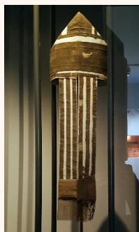
Anders Sunesens mitra.

Både teckningen av Anders Sunesens kranium, mitran och halslinet som han hade på sig och några andra föremål kan man se på i Domkyrkomuseet i Lund som är en del av Historiska Museet . För information om museets öppettider, se Historiska Museets webbplats .