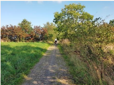
Början av stigen upp på Arendala.

Det är nästan 7 km att cykla dit från Lund , vilket tar mellan en halvtimme och en timme, och det är bra cykelväg nästan hela vägen .