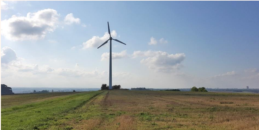
Platsen för Arendala tingsplats högst uppe på höjden mellan Lund och Dalby.

Lund , högst uppe på en höjd mellan de två viktiga kyrkooorterna Lund och Dalby. Uppe från höjden har man milsvid utsikt över det omgivande landskapet om det är klart väder.