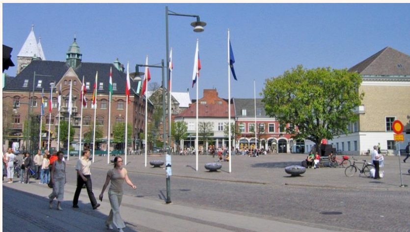
Stortorget i Lund, platsen för skånska landstinget under andra halvan av 1100-talet.

Under slutet av vikingatiden, sedan någon gång innan domkyrkan byggdes, och i början av medeltiden stod det ett högt torgkors vid norra änden av Stortorget. Såna torgkors fanns i flera engelska städer vid den tiden som en symbol för att kungen garanterade torgrifden där det bedrevs torghandel. På den tiden var också hela Stortorget träbrolagt med plank av ek sedan början av 1100-talet.