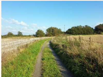
Den sista sträckan av stigen upp på Arendala.

Den sista sträckan upp på höjden är också vacker men det är väldigt kraftig stigning. En bit av stigen är i så dåligt skick att man behöver leda cykeln några hundra meter . Men den sista sträckan är det fin cykelväg igen.