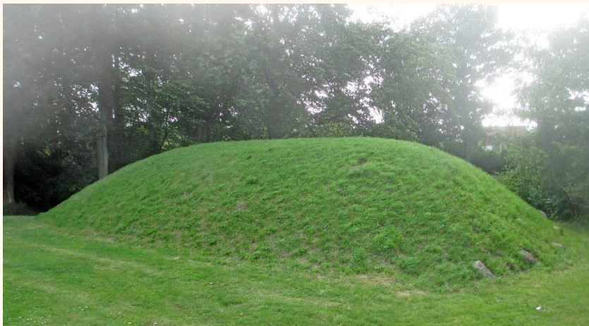
Lerbäckshög där Margareta Valdemarsdotter hyllades 1387 som ny tronföljare för Danmark.

som finns kvar än idag. Numera är området där den finns en park som kallas för Monumentparken eftersom Monumentet till minne över Slaget vid Lund också finns där. Ett annat äldre namn på platsen är Sliparebacken.